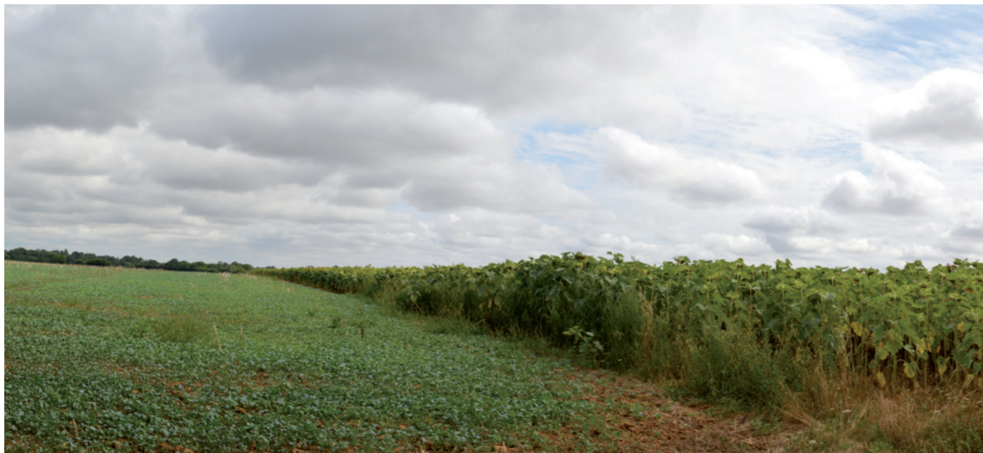
Photographie 3 : Parcelles de cultures ouvertes ponctuées par des boisements